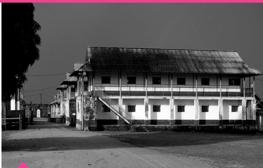
Cases du camp de la Transportation, collection CIAP de Saint-Laurent-du-Maroni/Michel Pierre, 2010.