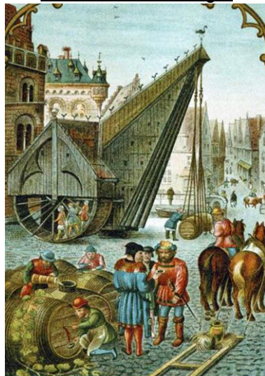
Grue de levage des tonneaux

Le sceau : il permet d'authentifier des actes. Utilisé par les rois au début du Moyen âge, cette signature va être récupérée par le pouvoir urbain. Le sceau donne à la commune une légitimité et lui permet aussi d'affirmer ses droits.