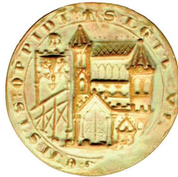
« Sigillum Brugensis Oppidi » : sceau de la place forte de Bruges

Le sceau : il permet d'authentifier des actes. Utilisé par les rois au début du Moyen âge, cette signature va être récupérée par le pouvoir urbain. Le sceau donne à la commune une légitimité et lui permet aussi d'affirmer ses droits.