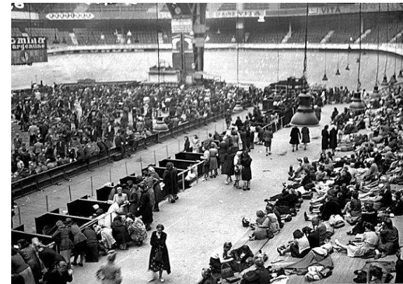
Document 4 : La rafle du Vel' d'Hiv' en 1942. Plus de 13 000 juifs sont arrêtés par la police française et livrés aux nazis.

Doc. 2 : Le maréchal Pétain rencontre Hitler le 24 octobre 1940 à Montoire (Loir et Cher) et déclare : « Une collaboration a été envisagée entre nos deux pays. J'en ai accepté le principe. »