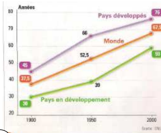
1 L'espérance de vie dans le monde au XX e siècle

5. Donne la nature et le thème du document 1 : 1pt